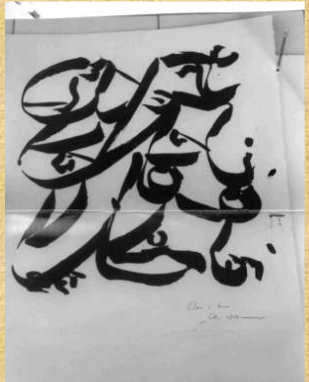
"Bon à tirer" tel qu'au jour de son achat