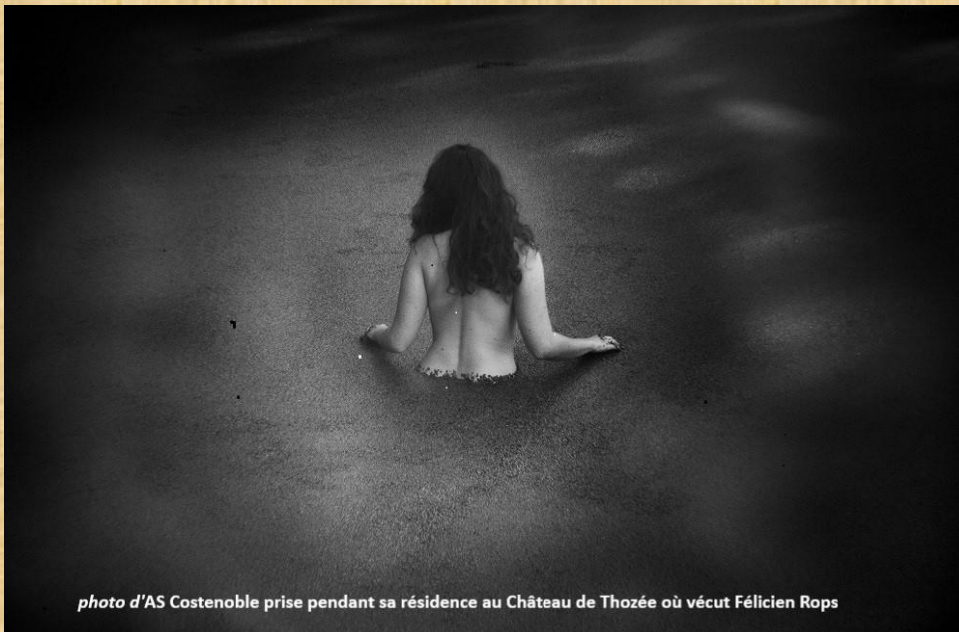
photo d'AS Costenoble prise pendant sa résidence au Château de Thozée où vécut Félicien Rops

(... La peau se moire, aussi trompeuse qu'une page... )