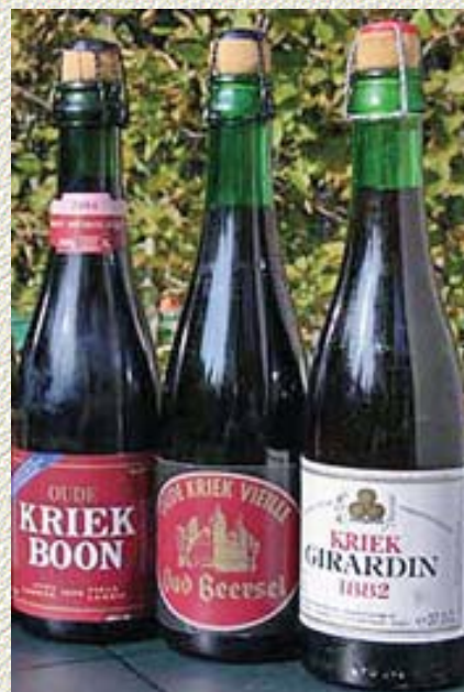
Kriek Boon, Kriek Oud Beersel en Kriek Girardin, alle drie “oude krieken” van topkwaliteit.

onontbeerlijk zijn voor de kwaliteit en de smaak van de kriekenlambiek. Dat er inderdaad een verschil in kwaliteit is, blijkt uit een onderzoek van Test-Aankoop. Ze schrijven daarover: “Echte, met lambiek en zure kersen gebrouwen, ambachtelijke kriek wordt een zeldzaamheid. Op 28 onderzochte producten beantwoorden er welgeteld zes aan alle criteria. Alle overige voldoen niet omdat ze geheel of gedeeltelijk met bier van hoge gisting worden gemaakt, omdat er kriekensap of zelfs artificiële aroma's worden toegevoegd en/of omdat ze bijgezoet zijn met suiker of met kunstmatige zoetstoffen” . Daarom zijn wij van “Het Goudblommeke