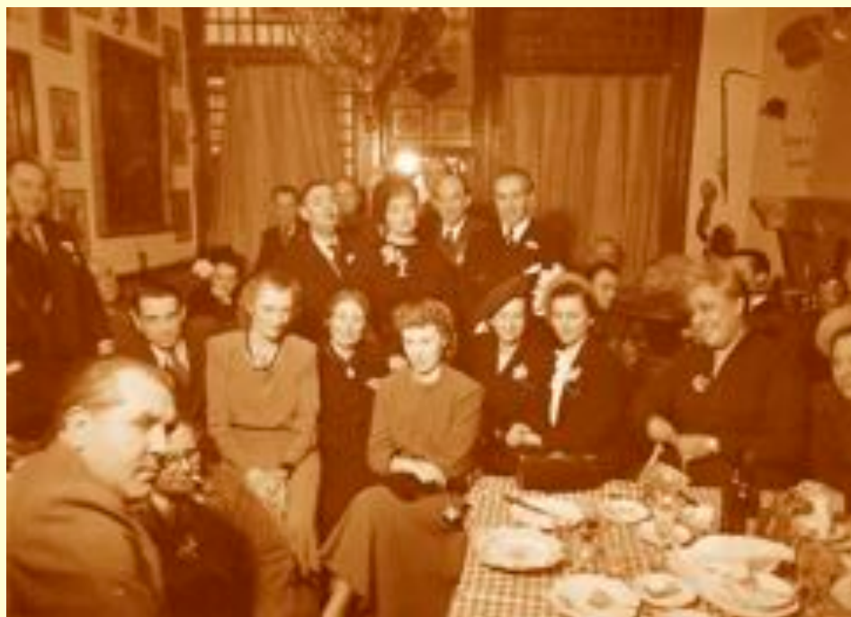
une des plus anciennes photos conservées de l'estaminet La Fleur en Papier Doré. (Le 8 avril 1947)